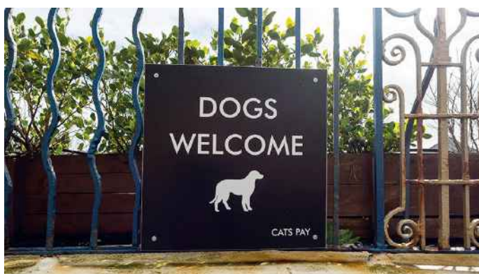
Le Royaume-Uni est une île qui s'est toujours montrée plutôt réticente aux chats, affichant un faible taux de possession.

animaux de compagnie. C'est aussi le cas pour les pays sud-américains. Outre le chien et le chat, l'analyse des taux de possession d'autres animaux de compagnie fait apparaître quelques traits saillants par région ou par pays. L'oisellerie de cage reste, par exemple, encore populaire en Italie ou en Turquie. Quant à l'aquariophilie, si elle rencontre toujours un franc succès dans les pays du nord de l'Europe, elle est aussi présente dans de nombreux autres pays européens et sur