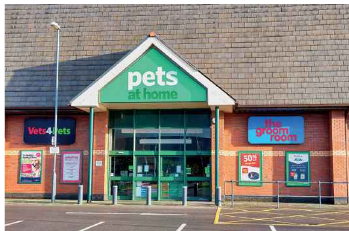
L'enseigne d'animalerie britannique Pets at Home compte 360 magasins et un chiffre d'affaires, sur son exercice 2019, de 961 millions de livres (1,085 milliard d'euros environ).

D'autres réseaux importants, comme Pet Supplies, Pet valu, Pet Supermarket ou Petsense,