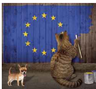
Sur l'ensemble des pays européens (y compris hors de l'Union européenne), 25 % des foyers européens possèdent au moins un chat et 24 % au moins un chien.

toute la planète, notamment en Chine. Le Royaume-Uni se distingue, lui, par un engouement pour les petits mammifères, en particulier les lapins nains. La poule de compagnie se développe dans les marchés matures, en Europe comme aux États-Unis. C'est aussi le cas des produits destinés aux oiseaux de la nature, pour lesquels le Royaume-Uni est un acteur majeur. La terrariophilie est également universelle, se développant aussi bien dans les pays du nord de l'Europe que dans ceux du sud.