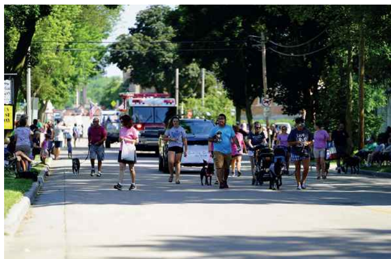
Aux États-Unis, 48 % des foyers possèdent au moins un chien et 38 % au moins un chat.

Selon les données de l'APPA, les ventes d'aliments et de friandises