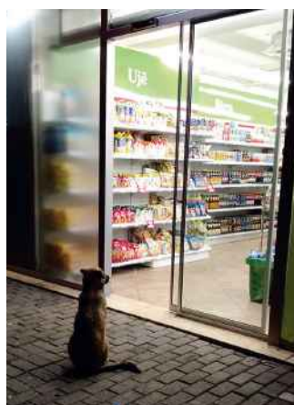
En Europe, les ventes de pet food pour chiens et chats sont estimées à 21 milliards d'euros pour l'année 2018 (8,8 millions de tonnes en volume), progressant à un rythme annuel de +2,5% sur les trois dernières années.

AUX ÉTATS-UNIS, PETSMART ET PETCO ATTIRENT À ELLES SEULES 48 % DES POSSESSEURS DE CHIENS ET 44 % DES POSSESSEURS DE CHATS.