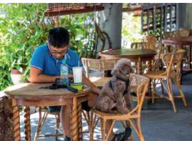
La chine compterait un taux de possession de chiens de 11 % dans les grandes villes.

qui correspondent à la nature carnivore des chiens et des chats, mais aussi d'aliments sans céréales, a débuté aux États-Unis, où elle génère aujourd'hui des parts de marché conséquentes. La tendance impacte également le marché européen. Ainsi, en France, cette catégorie devrait peser, d'ici fin 2020, environ 270 millions d'euros de chiffre d'affaires, soit 8 % de l'ensemble du marché du pet food, tous secteurs confondus (sources : Nielsen fin 2018 + GFK + données internes industriels). S'ils se rejoignent sur leur valeur globale, les marchés majeurs de l'animalerie européenne se rejoignent également sur les tendances des produits. Le