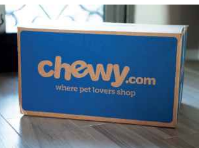
Racheté par PetSmart en 2017, Chewy, le leader américain du e-commerce de produits pour animaux de compagnie, a généré un chiffre d'affaires de 3,53 milliards de dollars (3,23 milliards d'euros) en 2018.

En Europe, le paysage de la distribution des produits « pet » est différent de celui des États-Unis car la grande distribution alimentaire y tient une place plus importante. En effet, la prégnance des grandes et moyennes surfaces alimentaires (hypermarchés, supermarchés) mais aussi des circuits de proximité s'illustre par une part de